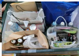
「古町どんどん」で寄贈された食品